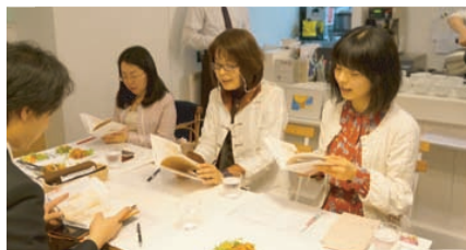
[4/24] 出発前日は「匠カフェ aotto」さんと朗読カフェ☆夜は羽田空港近くのホテルに…