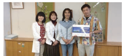
[4/25] 「豊見城市立中央図書館」さんを通して県内47ヶ所の図書館に紙芝居を寄贈していただけることになりました！豊見城市では、この他に家庭児童課さんを通して市内120ヶ所の教育機関や児童施設に紙芝居をお贈りいただきます。