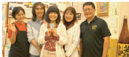
[4/25] うるま市の「神村酒造」さんを訪問！紙芝居プロジェクト立ち上げ時から、ずっと応援し続けていただき感謝でいっぱいです！