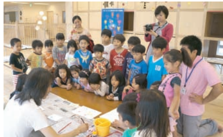
[4/26] 名護市にある「星のしずく保育園」と「銀のすず保育園」の年長さんと一緒に紙芝居づくりを行いました！絵を描くのが得意でない子ども目を輝かせながら描いてくれました☆