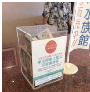
名護の滞在中、ずっとお世話になっていた「ホテルゆがふいんおきなわ」さんでは、今も東日本大震災の義援金箱が置かれており、中には皆様からのお気持ちがたくさん入っていました！継続的なご支援に感動！