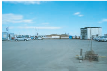
左と中央：3月4～5日。いつも家族のように迎えてくださる気仙沼市本吉町の皆様。右：第二作目の杉木立は切れ、段々と気仙沼大島も見えづらくなっている。