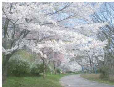
2012年4月下旬。美しく咲く福島市内の桜。しかし放射線量が高いため他には誰もいません。早く皆様の心にも温かな春が訪れますように…

本シリーズは、これで一旦完結となりますが、まだまだ訪れた場所には描きたい原風景が数多くあります。そして東北のみならず、今後も活動の中で訪れた各地の原風景を描き続けてまいりたいと思います。これからもどうぞ宜しくお願い致します。はせがわいさお