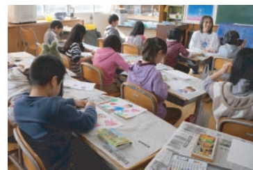
福島県須賀川市立うつみね児童館の皆様、宮城県石巻市渡波地区の皆様、宮城県気仙沼市小泉小学校の皆様、岩手県大船渡保育園の皆様。本当にありがとうございます！

スターリイマン紙芝居プロジェクト 第三幕 「子ども達の夢の紙芝居づくり」 震災から二年。人々の心は、少しずつ少しずつ前を向き始めています。私たちが活動の中で出会った子ども達は、厳しい状況下でも、笑顔を絶やさずに夢を持って懸命に生きていました。きっと先行きが見えず不安を抱えているのは、被災地だけではありません。この先、どんなに苦しい道が続くとしても、子ども達が希望を失うことなく、大切な夢を叶えられますように…これから日本の子ども達と一緒に紙芝居づくりを通して、輝く未来をつないでいきます。その第一弾として、三月二日から八日まで、若手・宮城・福島の子も達と紙芝居づくりを行ってまいりました。子ども達の描いた作品は、「被災地の未来を輝かす心の原風景」の九作の企画展と共に日本各地を巡ります☆まずは、五月のGWに、紙芝居プロジェクト誕生の地・沖繩へ…今後の展開に乞うご期待ください！