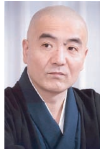
理事長 玄侑 宗久

2011年3月に起きた原発事故以来、福島県を離れて長期の避難を余儀なくされている子供・若者を含む方々は6万人に上ります。たまきはる福島基金(一般社団法人ふくしま原発避難子供・若者支援機構)では、三春町在住の芥川賞作家・玄侑宗久氏(東日本大震災復興構想会議委員)を理事長、双葉郡内6町村と伊達郡川俣町、相馬郡飯館村の首長などが理事(飯館村村長は監事)となり、避難を続ける子供たちの活動支援・学習支援、帰還者の生活支援などの活動を行っています。